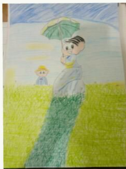
Gustavo Turina- Mônica com guarda-chuva